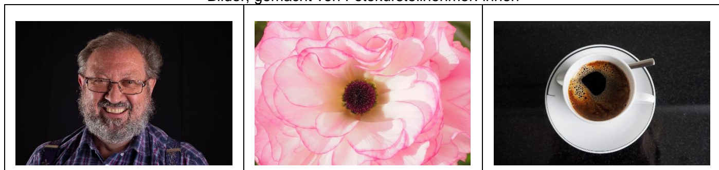
Bilder, gemacht von Fotokursteilnehmer: innen